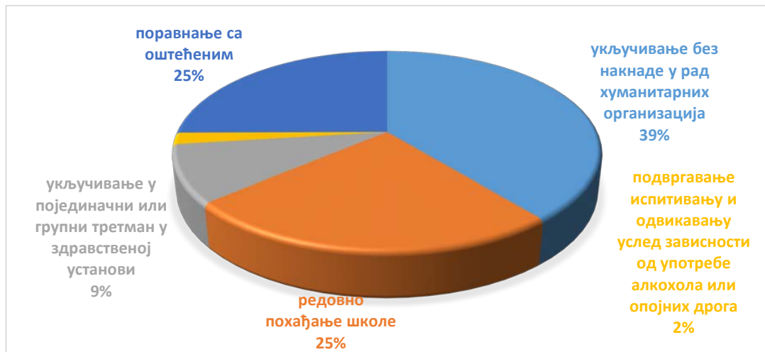
Графикон 1. Однос поравнања и осталих васпитних налога

Сходно сликовитом графичком приказу, поравнање са оштећеним је као вансудски или диверзиони модел примењено у 25% случајева. У односу на преостале примењене васпитне налоге, овај је вид медијације једини налог ресторативног карактера.