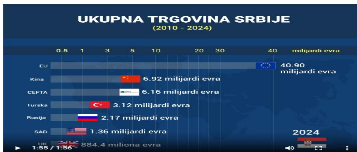
Графикон 4: Укупна трговина Србије (2010-2024) 130

У периоду од 2015 до 2019. године удео извоза је у опсегу од 63,2% до 66% укупног извоза Србије. У истом периоду, удео увоза из ЕУ је у опсегу од 63,6% до 68,3% укупног увоза Србије. Може се закључити да Србија има значајне користи од трговинске и економске интеграције са ЕУ, те да је ЕУ кључни трговински партнер Србије.