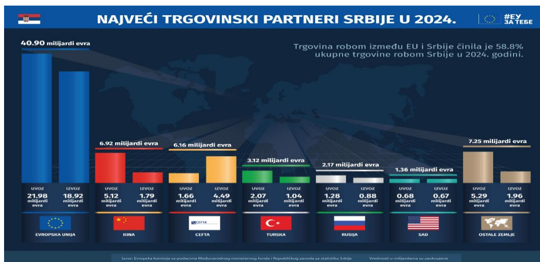
Графicon 3: Трговински партнери Србије у 2024. години 128

Србија је значајно профитирала од трговинске и економске интеграције са ЕУ. ЕУ је традиционално кључни трговински партнер Србије који чини више од 60% укупне робне размене Србије 2020. године, са сличним процентима који се настављају годинама. Вредност српског извоза у ЕУ скоро се учетворостручила са скоро 3,2 милијарде евра у 2009. на преко 11 милијарди евра у 2021. години. 129