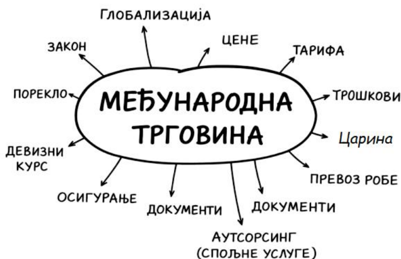
Слика 1. Елементи који чине међународну трговину. 12

Ова теорија наглашава да трговина може бити обострано корисна и да доприноси укупном економском развоју. 10 У савременом међународном систему, међународна трговина је институционализована кроз деловање међународних организација, пре свега Светске трговинске организације, која поставља правила и механизме за решавање трговинских спорова. Ипак, како истиче Шафер (Shaffer), савремена међународна трговина се суочава са бројним изазовима, укључујући социоекономске диспаритете и еколошка питања, што наглашава потребу за њеним правним и економским преиспитивањем. 11 Слика 1. показује елементе међународне трговине.