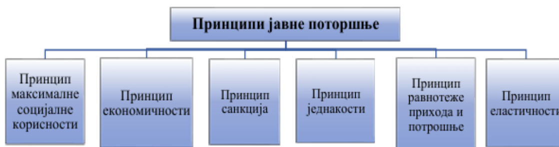
Слика 1: Принципи јавне потрошње

Ови принципи обезбеђују да средства која држава прикупља и троши буду искоришћена на ефикасан и оптималан начин, максимизујући социјалну корист и стимулишући економски развој. Јавни расходи се тако постављају као алат државе за подстицање привредног раста, смањење неједнакости и одржавање економске стабилности.